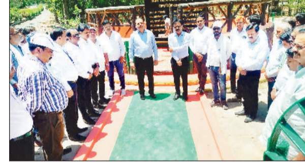
श्रद्धांजलि अर्पित करते अधिकारी-कर्मचारी व अन्य।