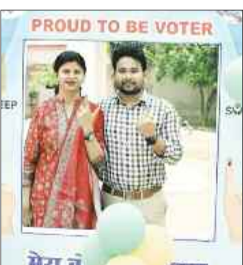
जिप सीईओ ने अपनी पत्नी के साथ किया मतदान।