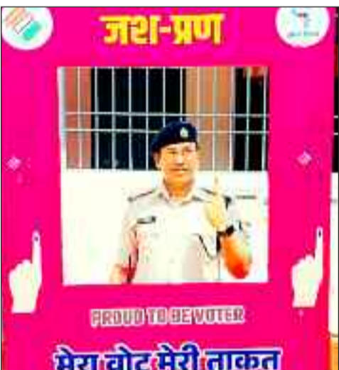
मतदान के बाद चिन्ह दिखाते एसपी।