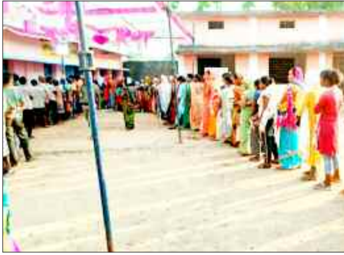
पथलगांव के मतदान केंद्र में लगी लंबी लाइन।