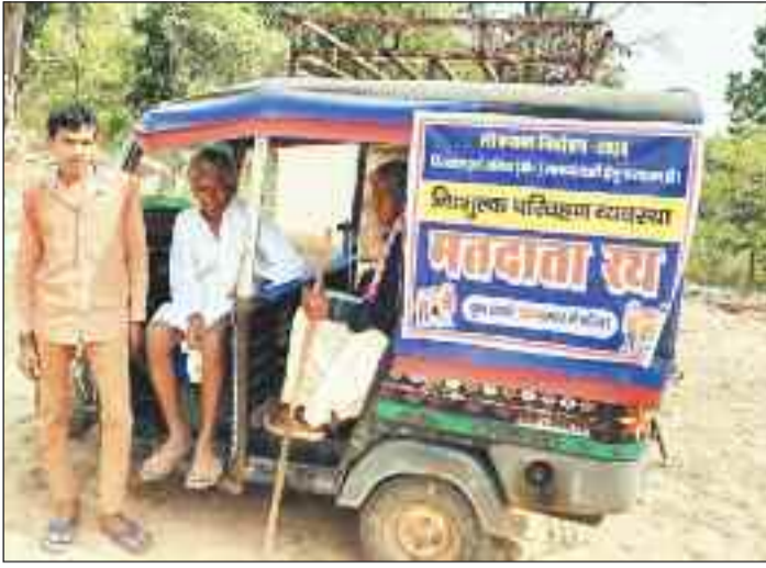
बुजुर्गों के लिए सरकार ने की थी मतदान रथ की व्यवस्था।